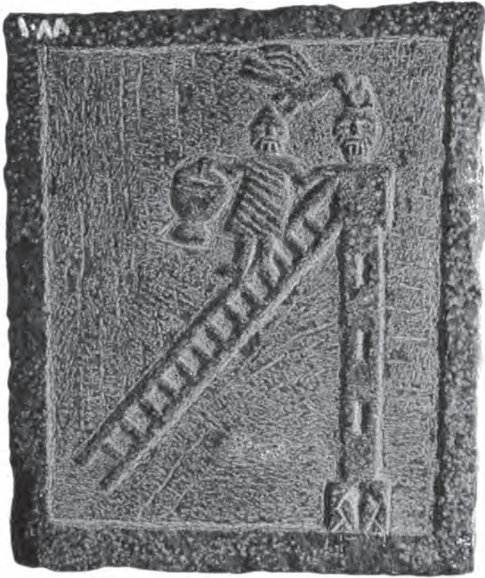
Basalt reliëf uit ongeveer 500 met een afbeelding van Simeon de Pilaarheilige, 80 cm hoog. Het hoofd van de heilige steekt boven de balustrade uit die bovenop de vijftien meter hoge pilaar was gebouwd. Een vogel kroont hem met een lauwerkrans, terwijl een monnik op een ladder een wierookvat brengt. Via de ladder kreeg Simeon ook eten en drinken aangereikt.