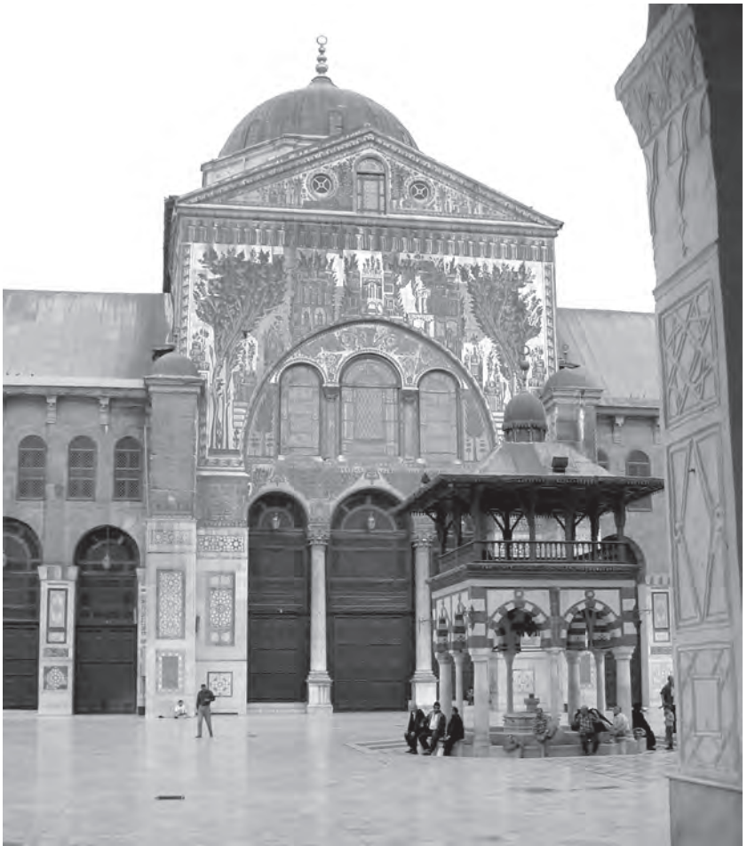
De naar de binnenhof gekeerde hoofdafaçade van de Omajjaden-moskee in Damascus. Bij de bouw van de moskee, in het begin van de achtste eeuw, werden door Byzantijns-Syrische kunstenaars mozaïeken met voorstellingen van paradijselijke tuinen aangebracht.